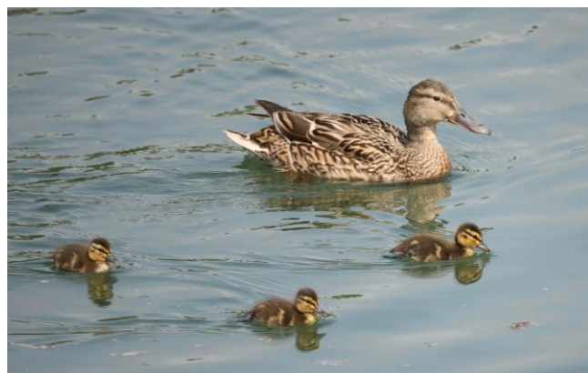
① マガモのヒナとメスの親鳥

長野県では諏訪湖などに、冬鳥として群れで渡来しています。約50年前に本州北部で、近年は琵琶湖や新潟県、東北地方の湖沼などで、繁殖例は増加傾向にあります。最近では県内でも繁殖が報告されています。2025年度も、天竜川の源である諏訪湖や佐久地方で繁殖を確認しました。