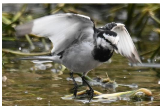
② ハクセキレイ