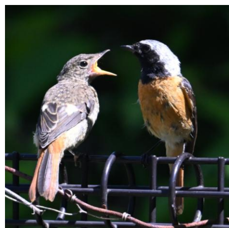
③ ジョウビタキのヒナとオスの親鳥