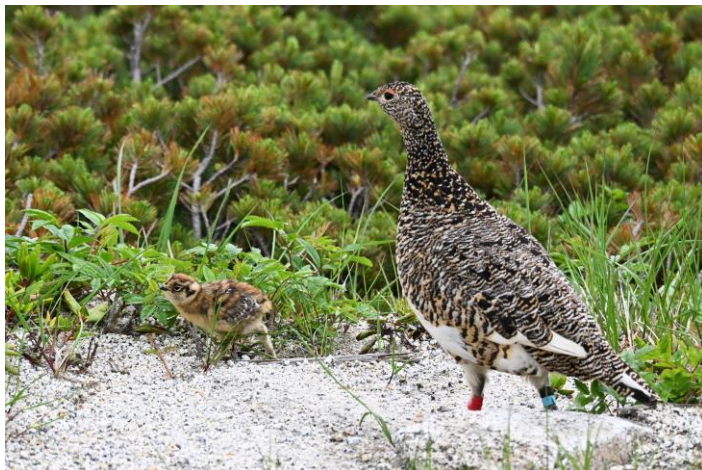
中央アルプスで生まれて自然下で成長するヒナと母鳥 2025年7月7日乗越浄土付近にて