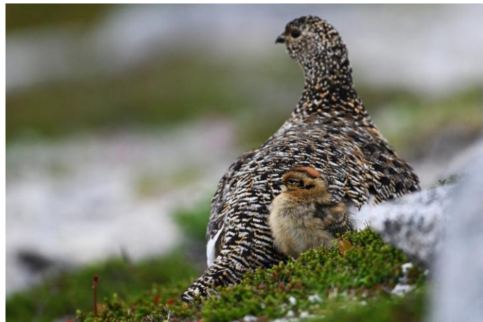
中央アルプスで生まれて自然下で成長するヒナと母鳥 2025年7月7日伊那前岳周辺にて