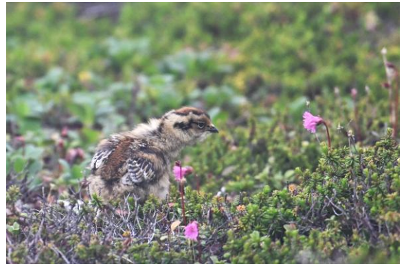
中央アルプスで生まれて自然下で成長するヒナ 2025年7月7日伊那前岳周辺にて

1969年を最後に目撃が途絶えて、中央アルプスのライチョウは絶滅したと考えられていました。しかし、2018年7月に登山者がメス1羽を目撃したのをきっかけに、中央アルプスでライチョウを復活させる環境省の事業が始まりました。2025年には、中央アルプス全域で約190羽の生息が確認されています。