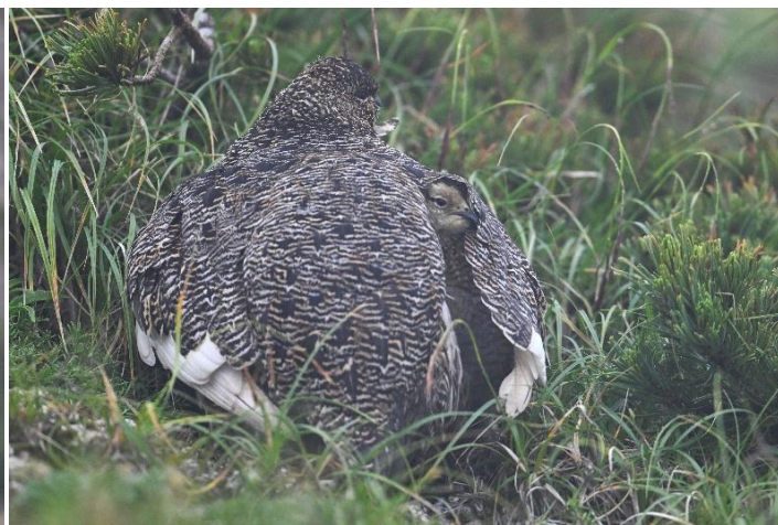
厳しい風雨を避けるため、ヒナを背中に入れるメス個体 2024年7月22日中岳北斜面にて