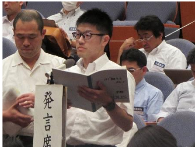
平和を守る上伊那支部の取組を伝える中野代議員